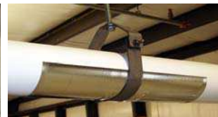
Reste dans le support